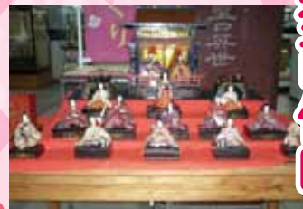
歴史あるお雛様やお雛様の掛け軸等をお楽しみください