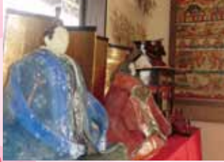
会津本郷焼で制作した「ひな人形」と絵皿を展示