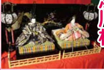
国宝指定の薬師如来や名誉村民たちの歴史を辿る