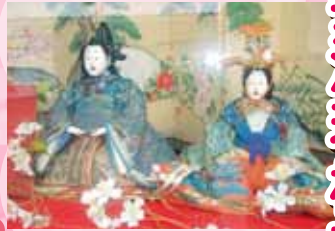
アネッサクラブ「のきさきギャラリー」をお楽しみください