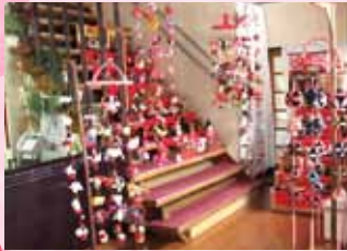
愛らしいおひな様との出会いを楽しみながら春の訪れを感じて下さい