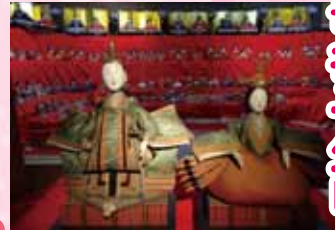
蔵のまちなか約80店舗のおひな様をゆっくりと散策してください