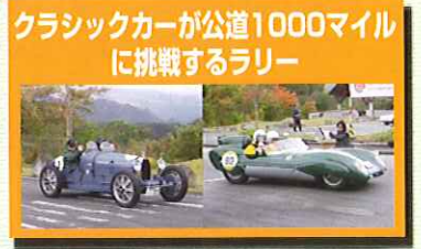
写真はLa Festa Mille Miglia 2009のものです。

森の工作体験 ○参加費：1,000円 ○開催時間：10時～15時 (受付は14時まで) ○所要時間：約30分