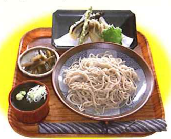
手打ち天ぷらそば (土・日・祝日限定)